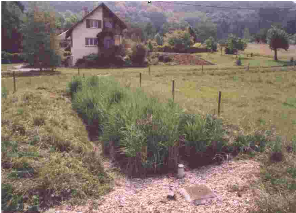
Station expérimentale à St Cassin (73)

Conception : bureau d'études ALP'EPUR – Université de Savoie (Laboratoire biologie appliquée)